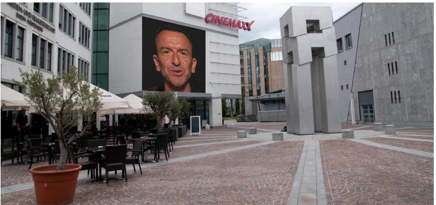
Projektion auf die Fassade des CineMaxx im BoschAreal, Stuttgart, vom 14. - 24. Oktober 2011 (Fotomontage)

Im Spannungsfeld von Individuum und Kollektiv ist es die besondere Vielfalt und Unverwechselbarkeit der individuellen Physiognomie, die immer wieder von Neuem fasziniert. Über 25.000 Portraits sind es, die sich bislang in Wolf Nkole Helzles weltweit angelegtem kommunikativen MedienKunst-Stück gleichberechtigt begegnen - eine gigantische Zahl und dennoch nur ein winziger Bruchteil des großen unüberschaubaren Ganzen.“