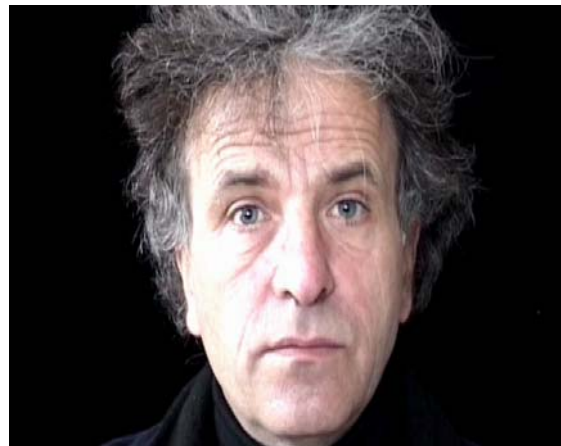
Art der Videoaufnahmen für egoshooter III