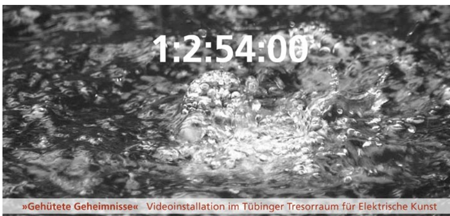
»Gehütete Geheimnisse« Videoinstallation im Tübinger Tresorraum für Elektrische Kunst

Am letzten Augustwochenende, vom 27. bis 29. August 2010, wird die Videoinstallation »Gehütete Geheimnisse« im Tübinger Tresorraum für Elektrische Kunst zu sehen sein. Eröffnung ist am Freitag, den 27. August um 21.00 Uhr ( www.kunstamt-tuebingen.de ).